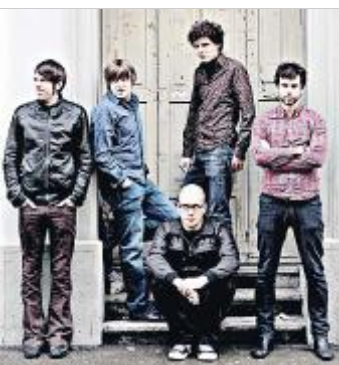
ROCKIG My Name Is George. HO

In den Handel kommt das neue Album von My Name Is George am 19. März. Kaufen kann man es aber schon länger: Bereits zwei Wochen vor dem offiziellen Release stellte es die Band auf ihrer Homepage zum Herunterladen bereit. Zahlen kann dafür jeder, soviel er will. «Wir wollen mit dem Album möglichst viele Leute erreichen», nennt der Sän-